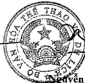
Nguyễn Ngọc Thiện

BỘ TRƯỞNG BỘ VĂN HÓA, THỂ THAO VÀ DU LỊCH