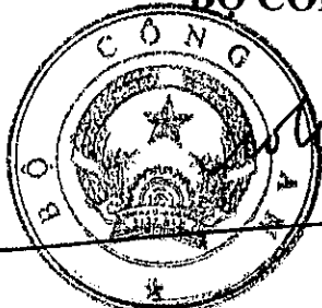
Thượng tướng Tô Lâm

BỘ TRƯỞNG BỘ VĂN HÓA, THỂ THAO VÀ DU LỊCH