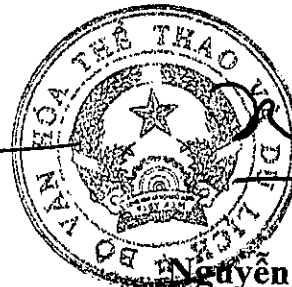
Nguyễn Ngọc Thiện

BỘ TRƯỞNG BỘ VĂN HÓA, THỂ THAO VÀ DU LỊCH